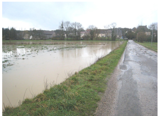
La Lanterne dans son lit mineur et lors de la dernière crue (février 2016)