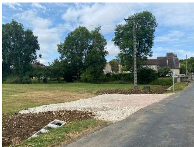
Rue des Barrots