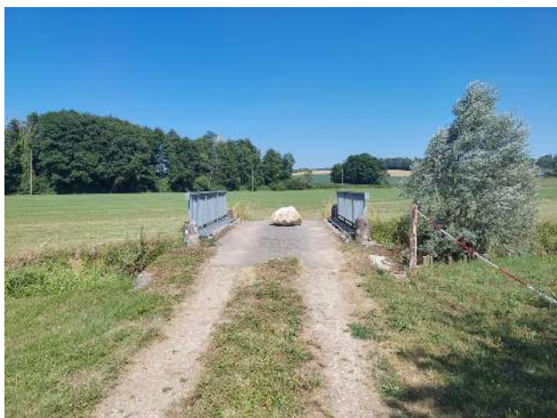
Pont du chemin des Prés

Le pont restera accessible aux piétons et cyclistes.